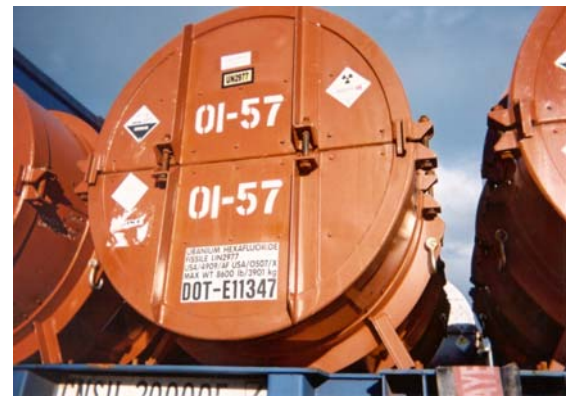
Exemple de colis homologué

Les colis conçus pour le transport de matières radioactives à risque élevé doivent être homologués par la CCSN avant d'être utilisés au Canada. Les personnes doivent inscrire l'usage d'un colis homologué auprès de la CCSN et indiquer qu'elles possèdent la formation nécessaire pour bien les préparer en vue de l'expédition. Ces colis doivent subir des tests rigoureux, car la manipulation incorrecte de leur contenu peut entraîner de graves conséquences. Les tests doivent simuler des conditions de transport tant normales qu'hypothétiques et comprennent une épreuve en chute libre, une épreuve de perforation, une épreuve thermique et des simulations d'accidents d'avion. Ces colis sont conçus pour transporter des matières telles que le Cobalt-60, les sources utilisées pour la radiographie industrielle, le combustible nucléaire usé ainsi que l'uranium enrichi.